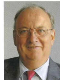
Dr. Eberhart v. Rantzaу, DAL Deutsche Afrika-Linien GmbH & Co KG